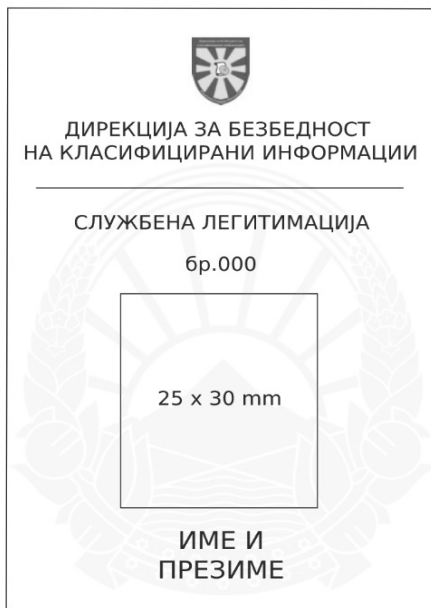
(Предна страна на легитимацијата)